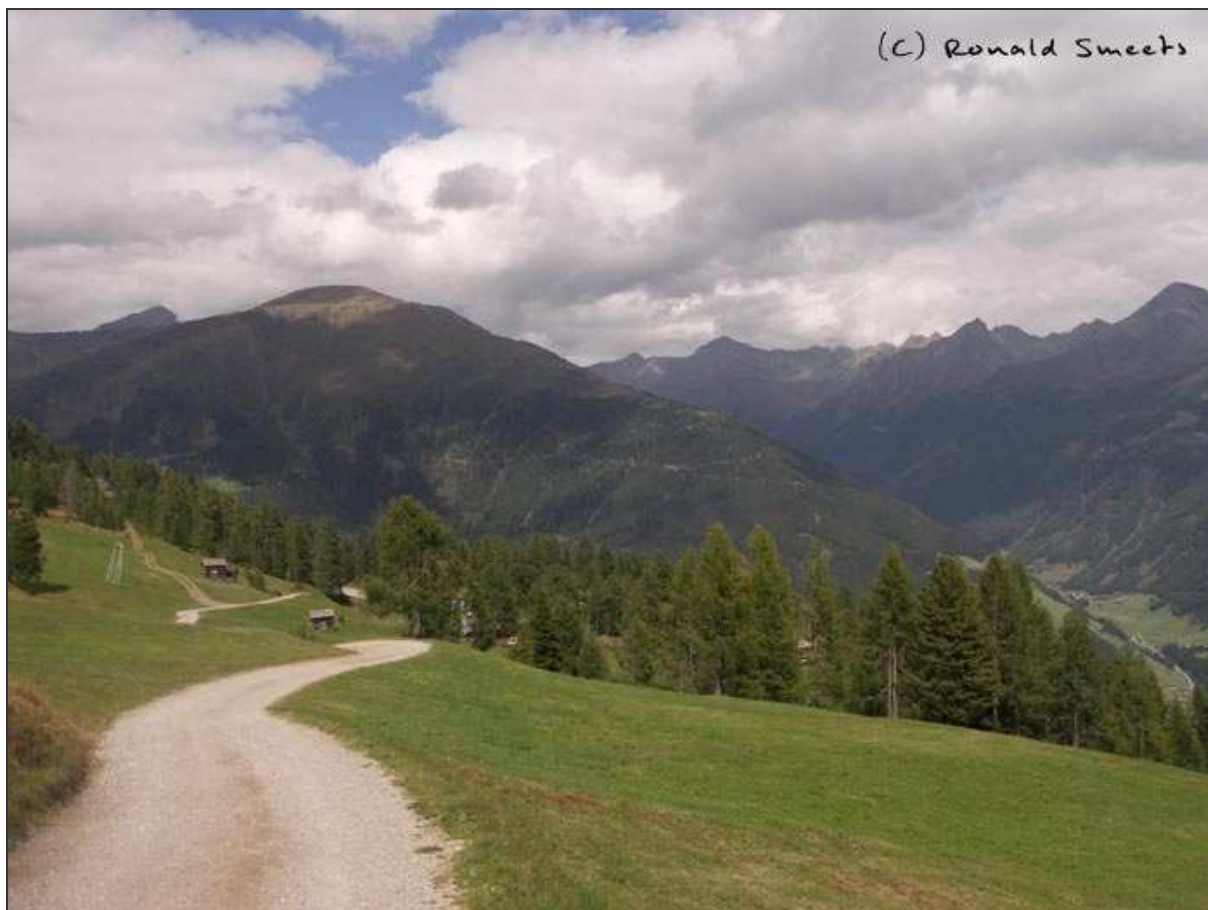
Tussen Thurntaler Rast en Gadain