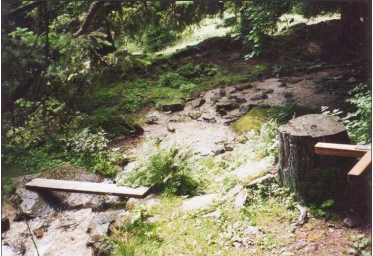
Af en toe is het een beetje behelpen :)